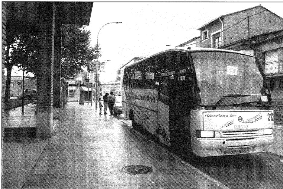
L'autobús de la línia N73 té parada a Sant Celoni i a d'altres municipis del Baix Montseny, i connecta amb Barcelona