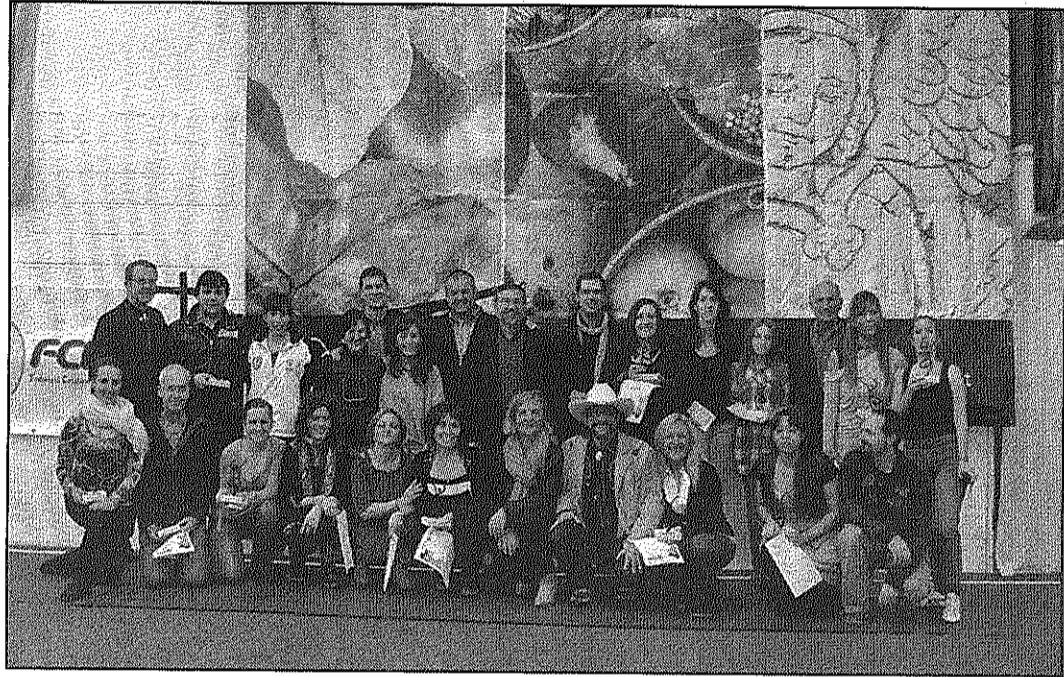
Els participants a la primera competició d'aquesta disciplina celebrada a la comarca

■ L'activitat estava convocada per l'associació Tots a la Pista