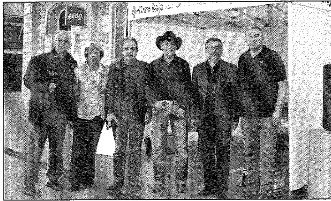
Voluntaris de l'Associació van convidar als veïns de Sant Celoni a fer una donació de sang (A&BM)