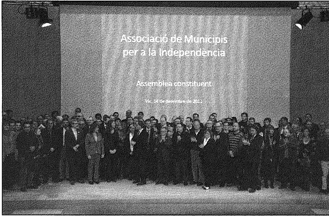
Una fotografia de l'acte celebrat aquest dimecres a Vic al teatre Atlàntida

■ Cardedeu, Fogars de Montclús i Sant Antoni ja hi estan integrats