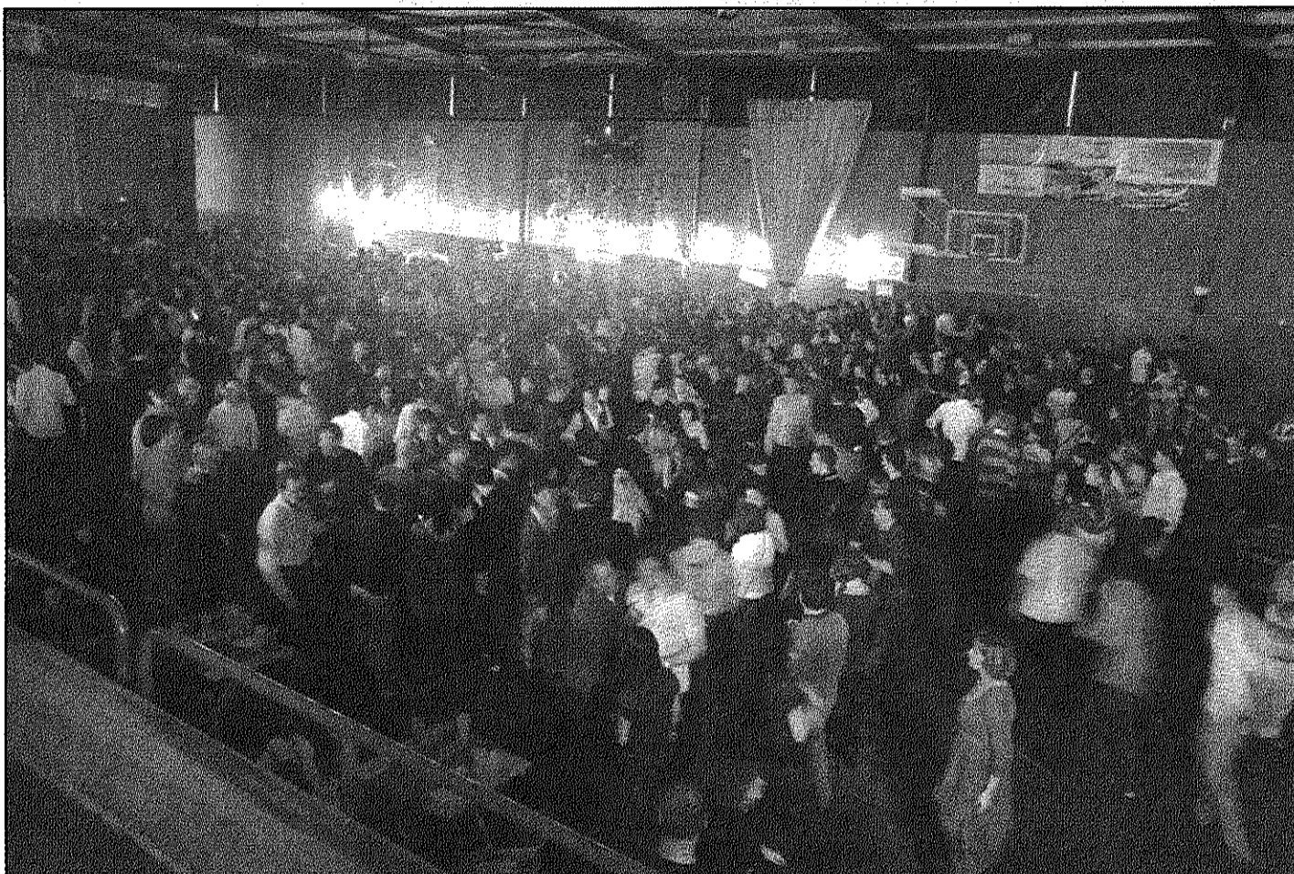
Imatge de la celebració de Cap d'Any al pavelló de Sant Celoni l'any passat (A&BM)

Sant Antoni de Vilamajor. A dos quarts de 12 de la nit, a les Escoles Velles, se celebraran les campanades de Cap d'Any a Sant Antoni de Vilamajor. I, a partir d'un