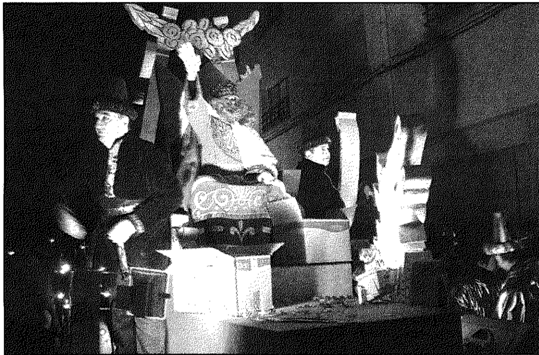
Una imatge de la cavalcada dels Tres Reis d'Orient a Sant Celoni

Cardedeu. Els Tres Reis d'Orient arribaran a l'estació