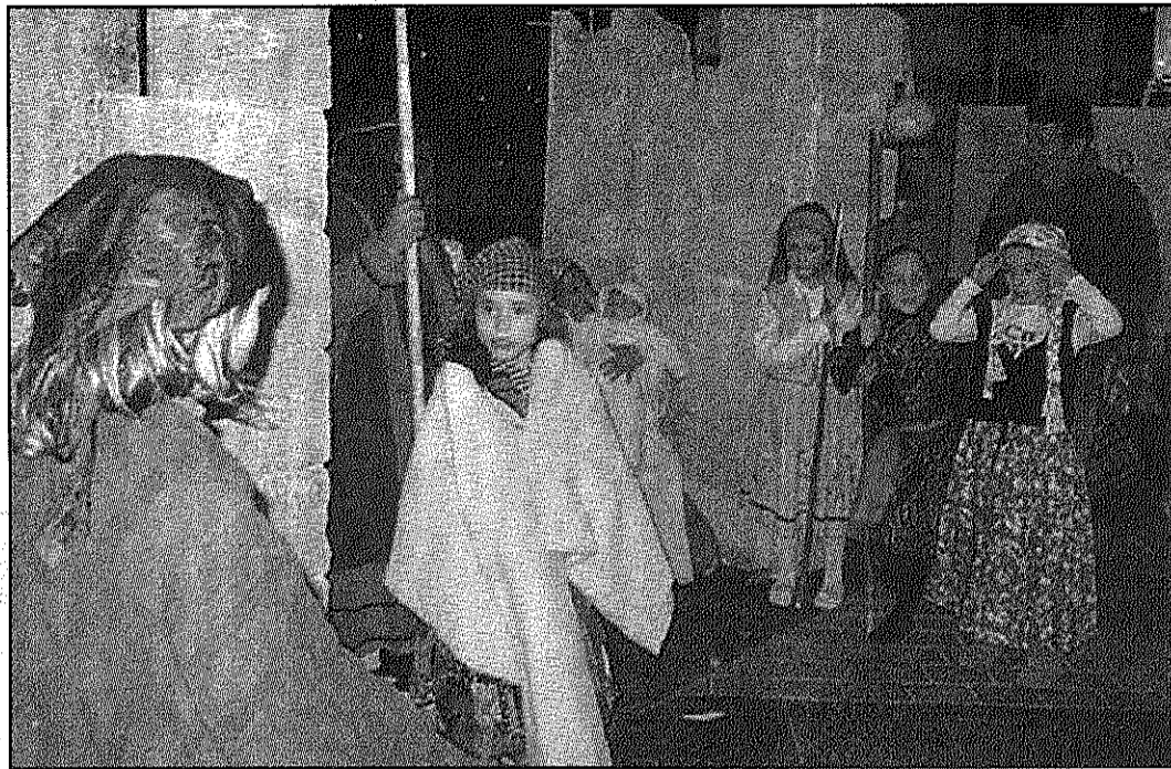
Les 'Estampes Nadalenques de Major de Dalt de Sant Celoni tanquen amb molt bona acollida (AaBM)