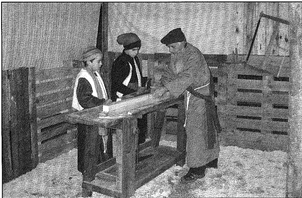
Una de les escenes que es van poder veure l'any passat al Pessebre Vivent de Vallgorguina (AaBM)

■ Sant Esteve n'acull un avui, divendres, conjunt amb Palautordera