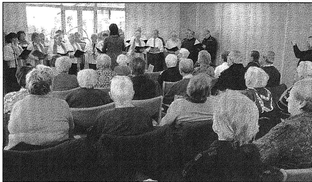
Una imatge del concert que va oferir la Coral de l'Esplai a l'Associació Neurològica (ANABM)