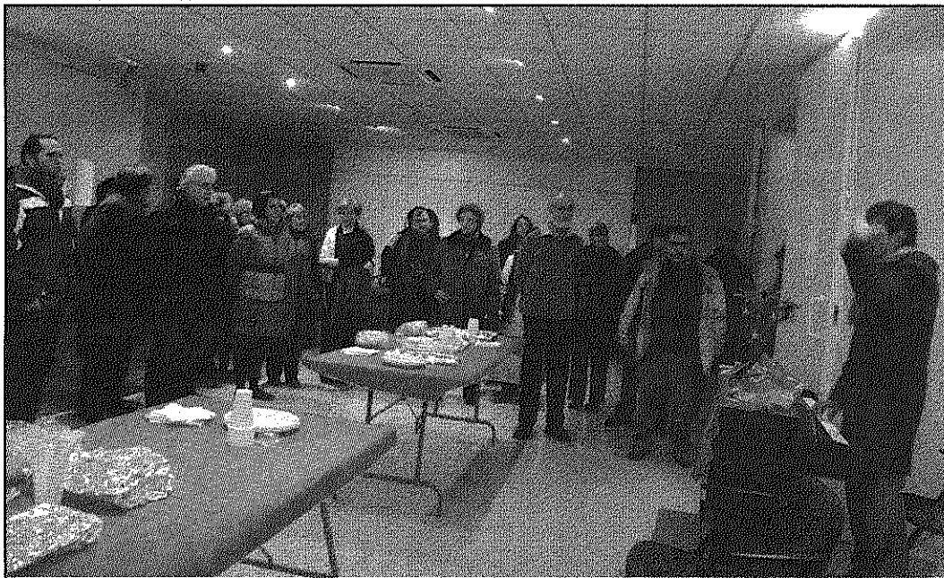
La Coral Briancó ha agrait a l'entitat que els hagi cedit l'ús de l'espai pels assajos