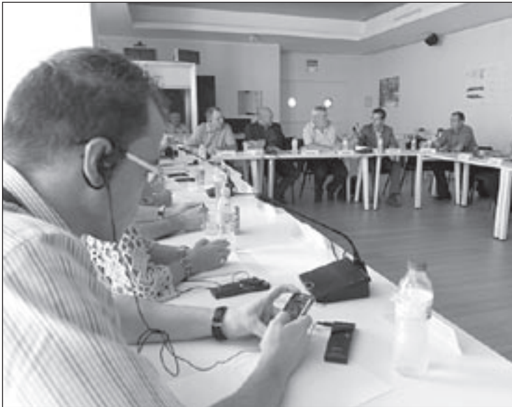
Assistents a la trobada de Mollet, aquest dijous