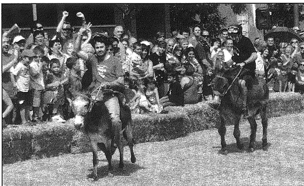
La Rucada va moure centenars de persones de públic fins a l'espai del Cardelús (AASC)