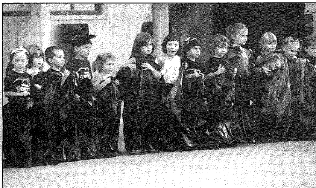
La cursa de sacs va ser una de les proves que van haver d'afrontar els més petits (AABM)