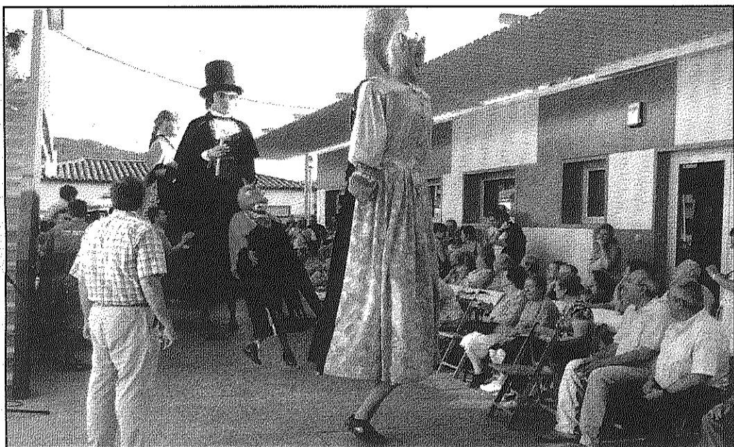
Els gegants van protagonitzar nombrosos actes, com la ballada a l'Associació Neuro Lògica (AASC)

Actes com el pregó, el sopar a la plaça de la Vila, l'arrossada popular o les barraques i els concerts tornen a fer el ple per la celebració