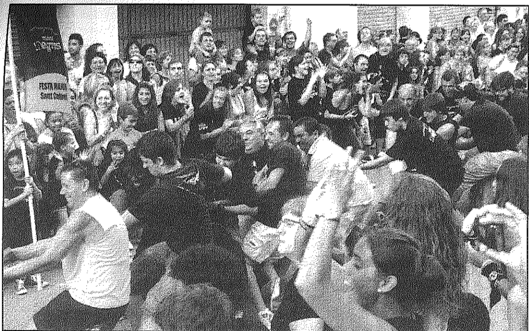
Els Negres van lluitar fins a l'últim moment per aconseguir tres punts a l'estirada de corda (AABM)