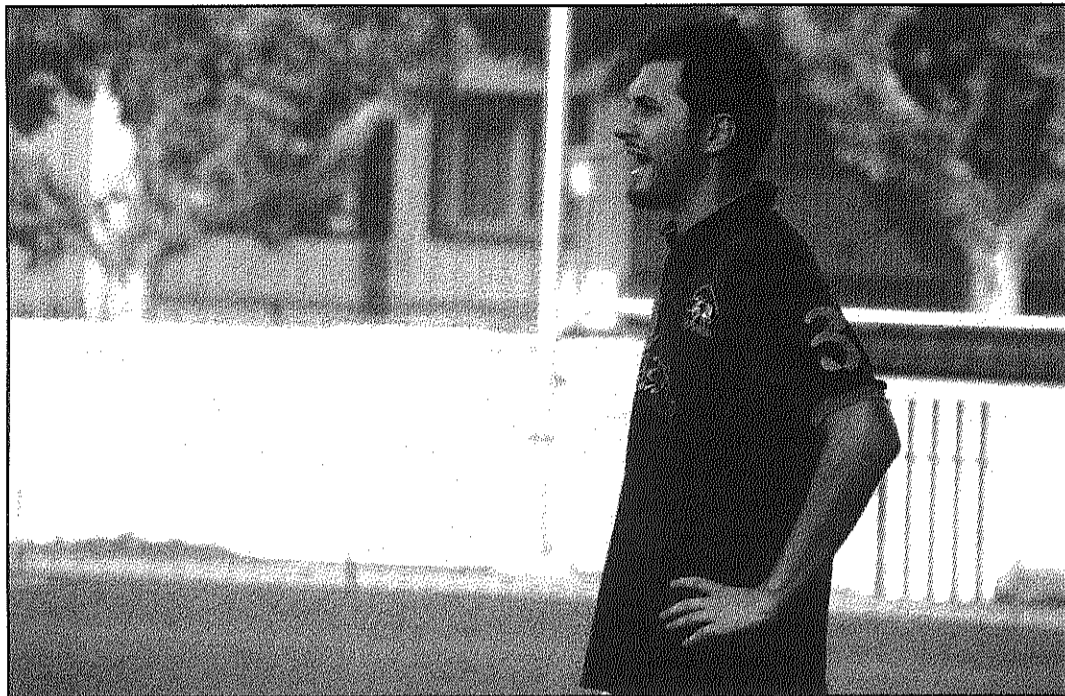
L'entrenador de l'AtC Hostalric comença la temporada amb una golejada dels seus jugadors (A&BM)

Aquest cap de setmana, l'equip ha de ratificar aquesta