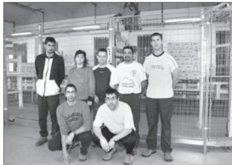
Els treballadors de la FVO que estan ocupats a la planta de Lloreda

La iniciativa és un pas més en la col·laboració entre Lloreda i la FVO que va engegar l'any 2003. Des de llavors, el Centre Especial de Treball (CET) Xavier Quincoces de la FVO fa manipulats industrials per a la firma de detergents. El 14 d'octubre les dues parts van firmar la creació de l'enclavament laboral i sis treballadors del CET es desplacen temporalment a la fàbrica. Els enclavaments