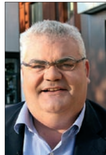
El diputat Feliu Guillaumes