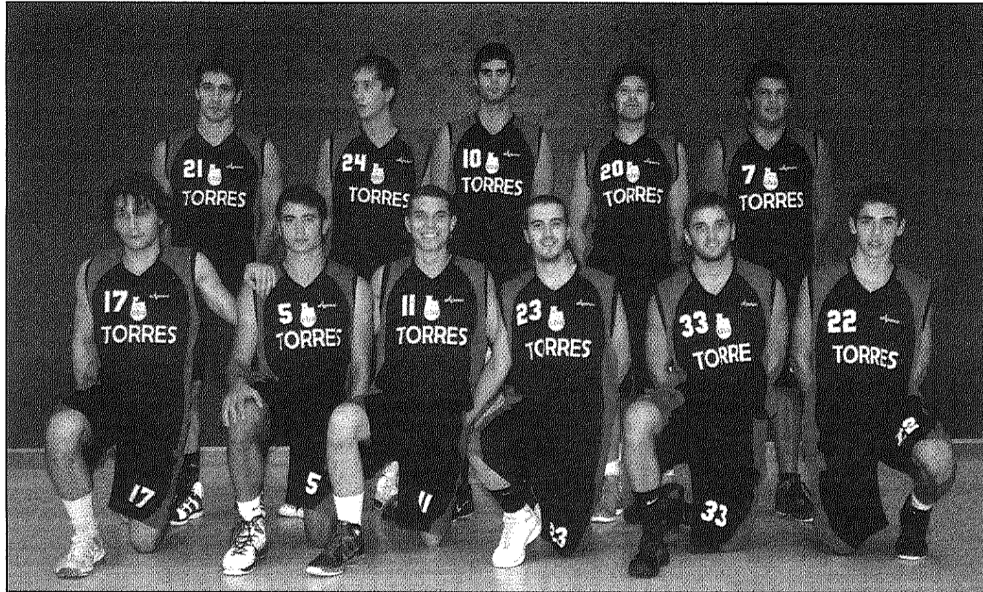
L'equip del CB Arbúcies abans de l'amistós preparatori que van jugar el cap de setmana passat a la seva pista

El derbi entre el CB Sant Celoni i el CB Llinars és el plat fort de la jornada inaugural