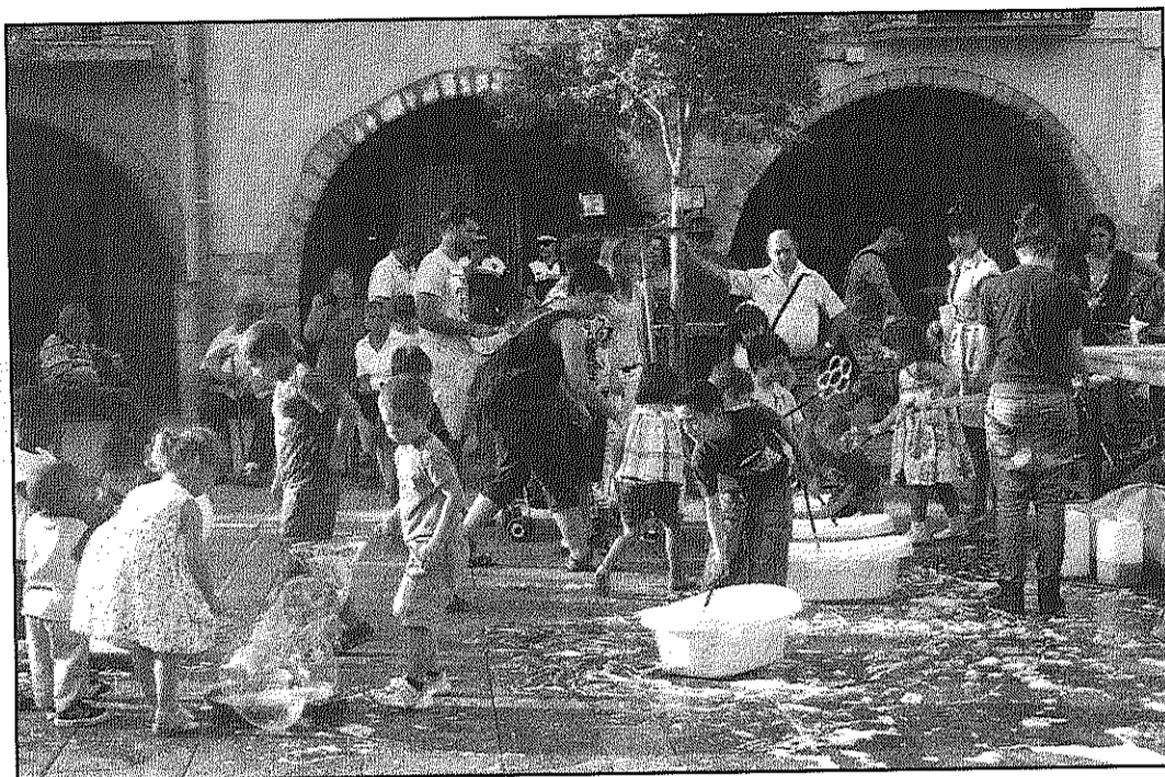
Una imatge de la presentació de la nova associació AFADIS Baix Montseny (AaBM)

Paral·lelament, a la plaça de la Vila, jocs infantils com ara bombolles de sabó o tallers de maquillatge entretenien els més petits. Les activitats van continuar amb una actuació musical per a tots els assistents. A més, durant tota la tarda, els curiosos que es-