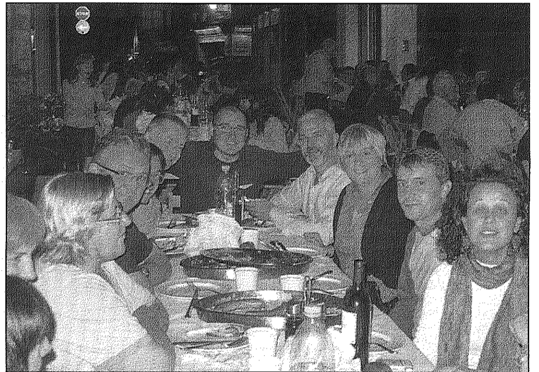
Centenars de persones acudeixen cada any al sopar a l'aire lliure del carrer Major de Dalt (AVBV)

■ Una xocolatada, ball de nit i rom cremat aquest dissabte al barri