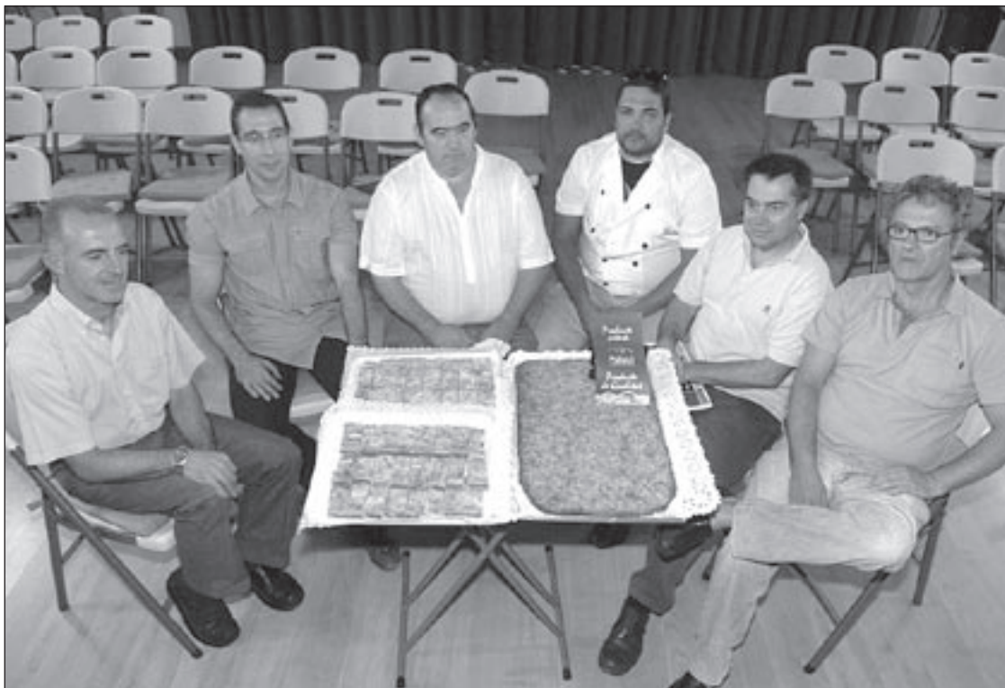
La coca, amb tots els seus responsables i creadors, es va presentar a principis d'aquest mes d'octubre

de juliol. Durant tot l'estiu, els artesans involucrats en aquest projecte han anat fent proves amb diversos ingredients per trobar-li el gust més adequat i buscant que la coca resultant fos un tipus de dolç que poguessin elaborar tots als seus obradors (per materials i ingredients, i per durada del procés). Els artesans s'han mostrat satisfets de la sortida del producte, del qual se'n venen entre 50 i 60 unitats durant els cap de setmana, i de la bona experiència que ha estat treballar tots junts. La versió definitiva de la coca de Palautordera conté una base de croissant i full, un farcit de massapà i ametlla filetejada i sucre per sobre. Ara, els forners i pastissers volen comercialitzar una variant d'aquesta coca