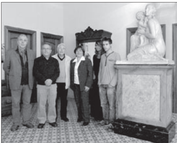
Els impulsors d'Òmnium Cultural a Sant Celoni, aquest dimecres

de la zona. Molt il·lusionats i amb moltes ganes de portar a terme molts projectes, els promotors han anunciat que una de les primeres accions que es portaran a terme serà demanar als Ajuntaments que presentin una moció a favor de la llengua catalana, així com també impulsar la participació de les escoles en projectes com el Premi Sambori per potenciar les lletres o el programa Quedem? , que pretén reforçar la cohesió social, entre d'altres. La subdelegació també promourà tots els actes proposats per l'entitat en els àmbits de