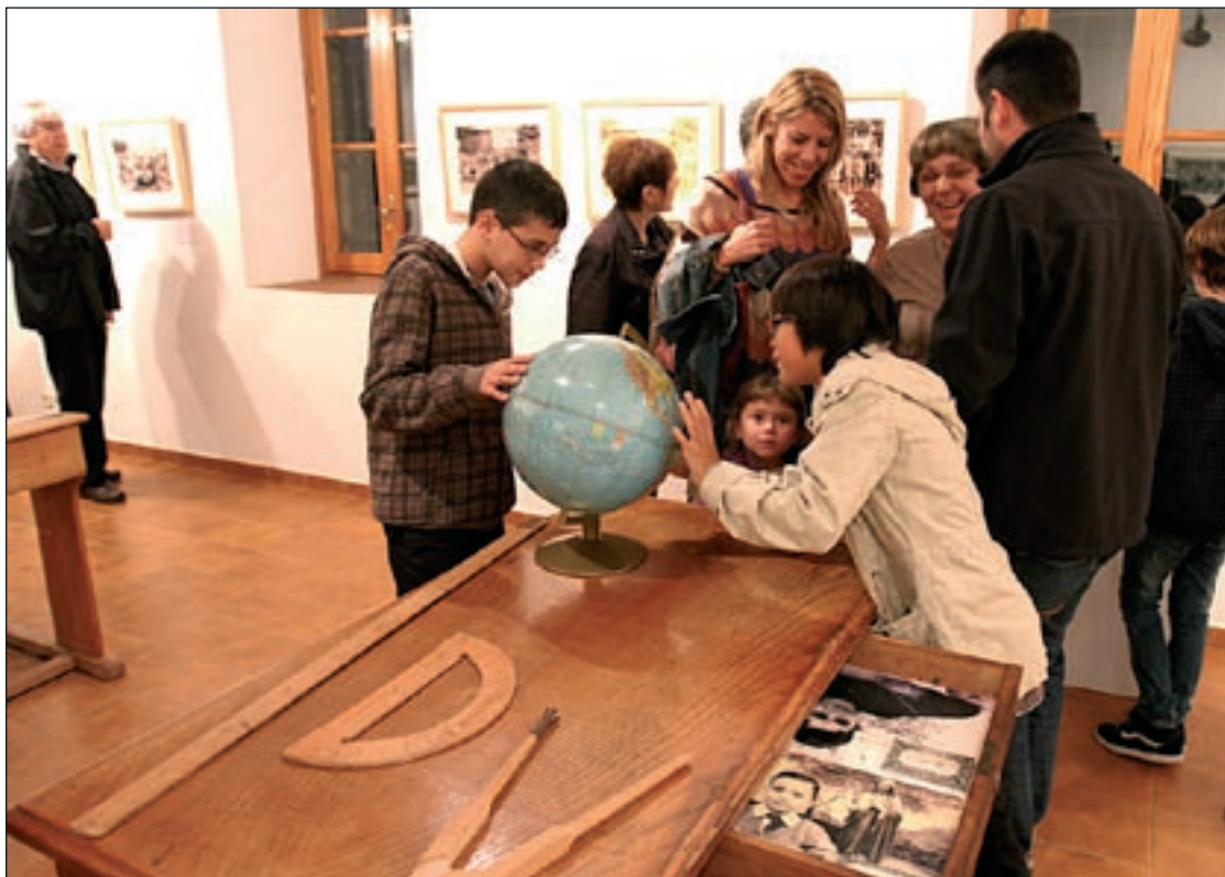
A banda de les fotografies, que són l'element principal de la mostra, també hi ha estris escolars de totes les èpoques

L'escola va donar les seves primeres passes en una casa del doctor Barri a la Carretera Vella, l'any 1911, quan van arribar els primers germans de La Salle al municipi i un grup de pares i prohoms de la vila, juntament amb l'Institut dels Germans de les Escoles Cristianes, van assumir la gestió del centre. Aleshores era el Col·legi de la Verge del Puig, conegut popularment com els hermanos o la Salle i només impartia classe a nens. Dos anys després de la seva obertura, el centre ja tenia 180 alumnes, fet