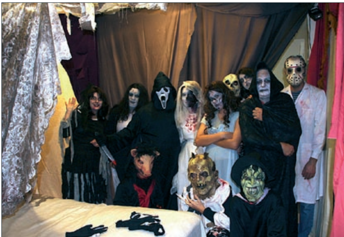
El actors del passatge del terror, enguany molt més llarg i elaborat gràcies a la col·laboració de molts veïns

Dissabte a la tarda es va celebrar el 2n Concurs de Carbasses, on es premiava la carbassa més gran, la més maca i la més ben guarnida. Una vintena de carbasses van estar exposades a l'entrada del pati de les escoles. Els guanyadors rebien el llibre Les plantes del nostre poble . Corró d'Amunt , elaborat per les veïnes del municipi Conxita Pericas i Glòria Puig. Més de 500 visitants van poder comprar castanyes, beure un got de brou ben