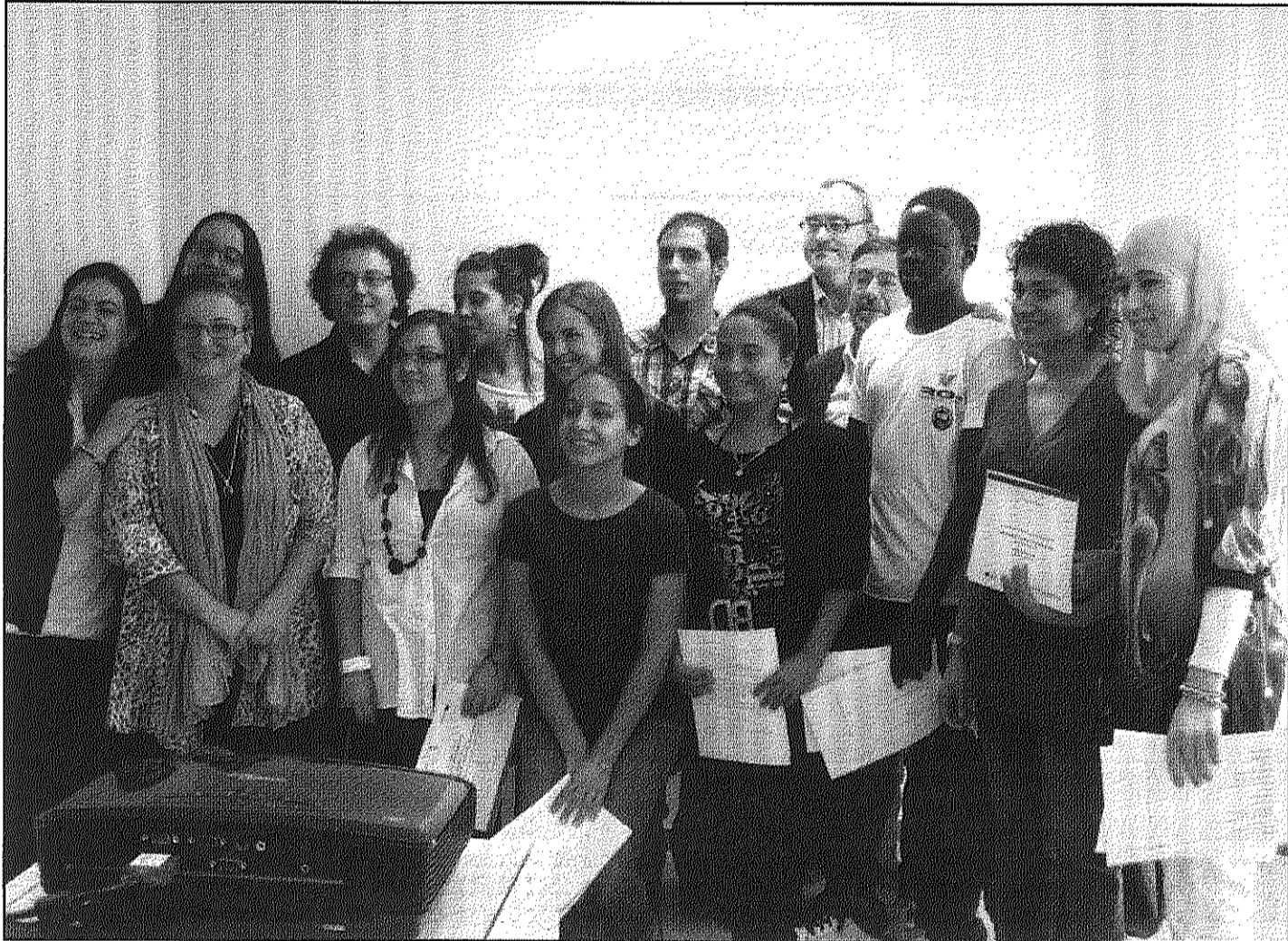
Deu alumnes han participat a la primera edició que s'organitza a Sant Celoni de la Casa d'Oficis (AdBM)

El programa de la Casa d'Oficis, d'un any de durada, ha estat promogut per l'Ajuntament de Sant Celoni amb el finançament del Servei d'Ocupació de Catalunya i el Fons Social Europeu, i ha permès a 10 joves del municipi adquirir els coneixements i les destreses necessàries per al desenvolupament de l'especialitat d'atenció geriàtrica. Durant els primers 6 mesos, els alum-