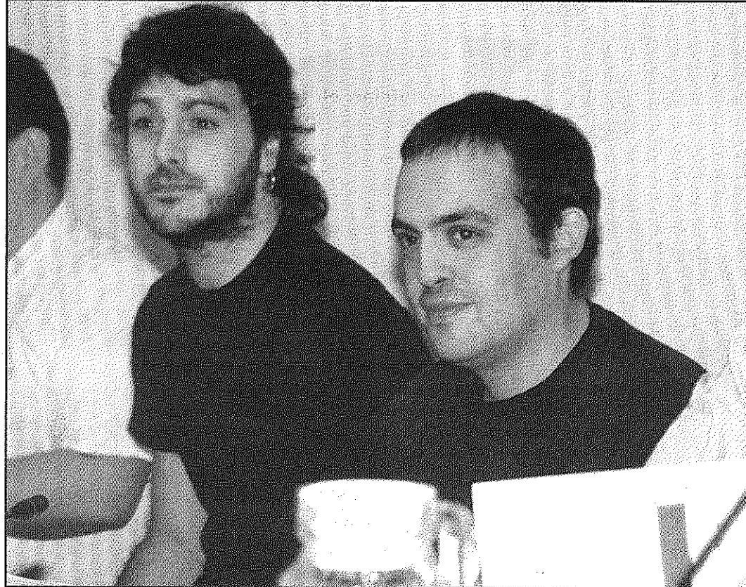
Els regidors de la CUP van pactar destinar uns 650.000 euros a despeses corrents i educació (A+B/M)

Castaño també va posar sobre la taula que als comptes del 2010 hi havia "un desviament d'1.700.000 euros" i que dels 1,4 milions que CiU esgrimia que hi havia d'estalvi a començament del 2010, durant els primers mesos de l'any se n'havien gastat 400.000 a través de resolucions d'alcaldia per pagar factures del 2010. Tampoc s'havia previst, va concloure Castaño,