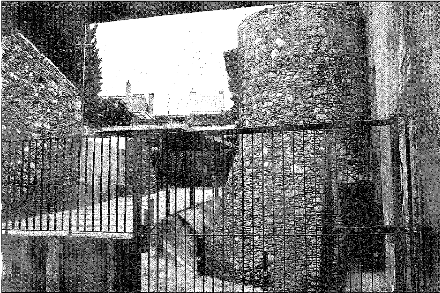
La torre de les Valls va ser l'últim element de l'antiga muralla que l'Ajuntament de Sant Celoni va recuperar i rehabilitar (A4BM)

La muralla de Sant Celoni, denominada la Força, és la que tancava originàriament