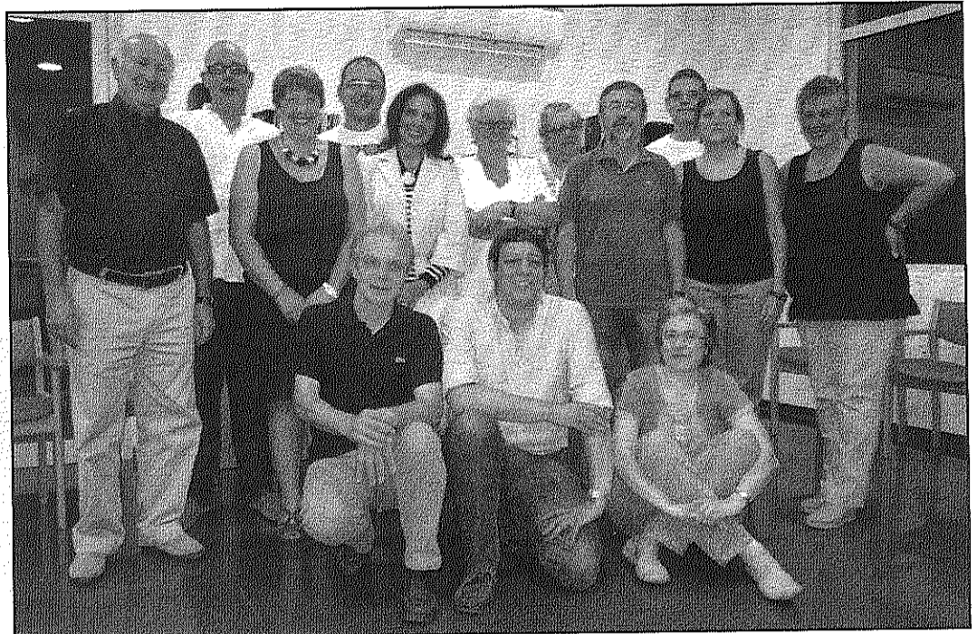
Una imatge del jurat que va seleccionar, divendres, el guanyador de la segona edició (ANABM)

L'Associació Neurològica Amics Baix Montseny (ANABM) va convocar el novembre de l'any passat la