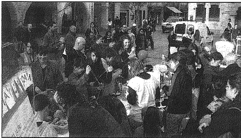
Una imatge de la festa celebrada a la plaça de la Vila dissabte

REDACCIÓ. Sant Celoni Els actes de la Setmana per la Pau de Sant Celoni, dedicada als conflictes oblidats d'arreu del món, van tancar dissabte amb un sopar solidari i una xerrada a la sala Cultural d'Unnim. Hores abans de l'àpat, però, la plaça de la Vila es va omplir d'activitat per la gran Festa solidària amenitzada per la Jovenut Alternativa de Sant Celoni (JASC), el grup Oicamina, diversos jocs, tallers i una fira del llibre de cooperació. En aquest acte, nens i nenes del municipi van decorar la plaça amb 1.535 grues de paper i amb desitjos de pau seguint la iniciativa d'una nena japonesa que va morir a causa dels efectes de la bomba d'Hiroshima.