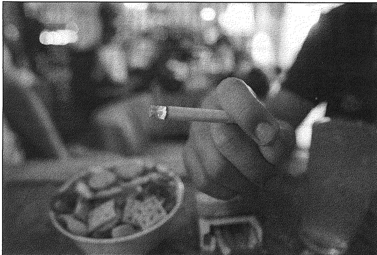
Nombrosos establiments consideren que la implantació de la llei els ha suposat un greuge (AIBM)

■ L'entitat compta amb associats a Sant Celoni, Sant Hilari Sacalm i Vallgorguina