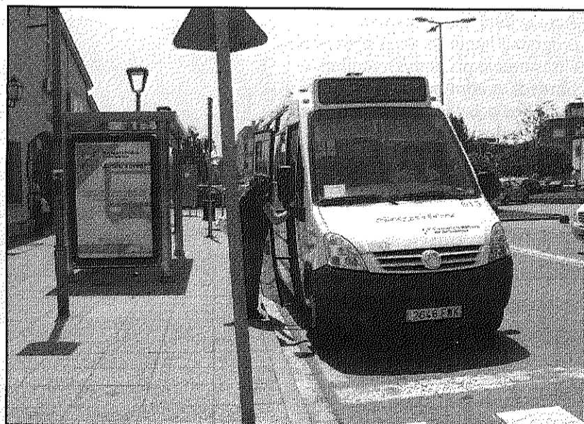
Augmenta de manera important l'ús d'aquest servei urbà (AdBM)

REDACCIÓ. Sant Celoni L'ús de l'autobús urbà de Sant Celoni ha experimentat, el 2010, un increment significatiu dels viatges, o cancel·lacions de bitllet, respecte l'any anterior. En total l'any ha tancat amb un augment del 13 per cent respecte el 2009, passant dels 26.645 viatges a 30.071 cancel·lacions en termes absoluts.