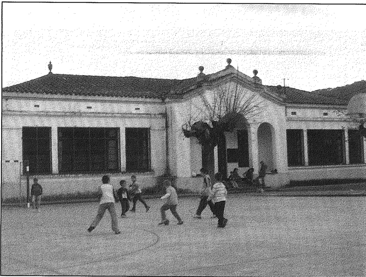
El president del Consell de Poble aposta perquè, si es pot, es dediqui a més d'un ús per a la vila (AdBM)

■ Les opcions més sòlides sobre la taula són el dispensari mèdic i el local per a joves