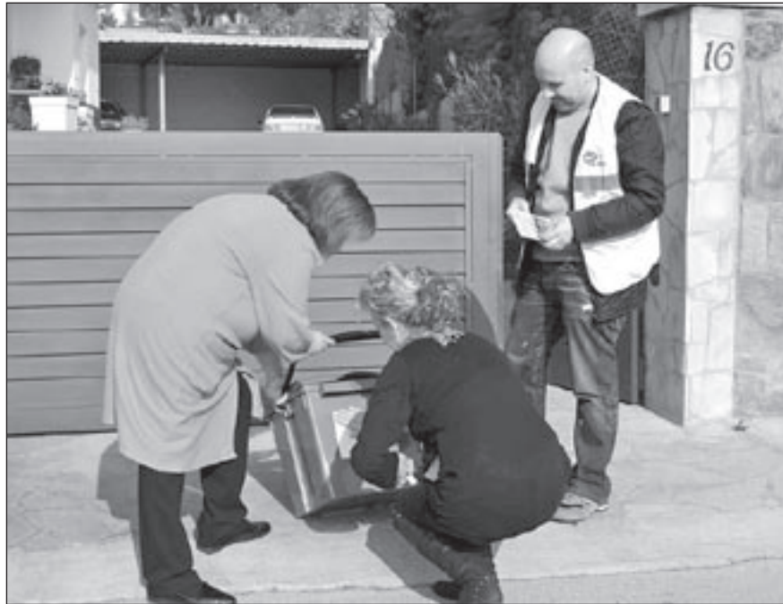
Un informador mostra el funcionament del contenidor a dues veïnes aquest dimecres

El servei porta per porta consisteix a deixar les bosses de rebuig i d'orgànica a la porta de casa, en els dies i hores establerts. Per a l'usuari augmenta la comoditat, però cal que faci una correcta separació dels residus. En cas contrari, les bosses no es recullen. Els veïns reben un cubell per a les bosses d'orgànica, un imant amb els horaris de recollida d'orgànica i de rebuig i un díptic