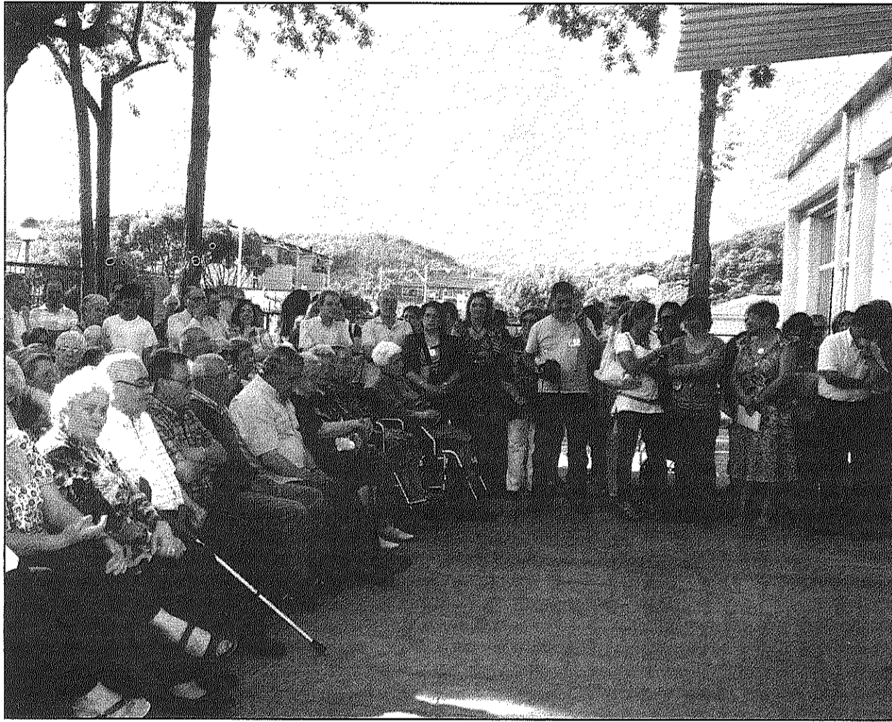
Una imatge de la inauguració del nou local de l'entitat, divendres passat a Sant Celoni