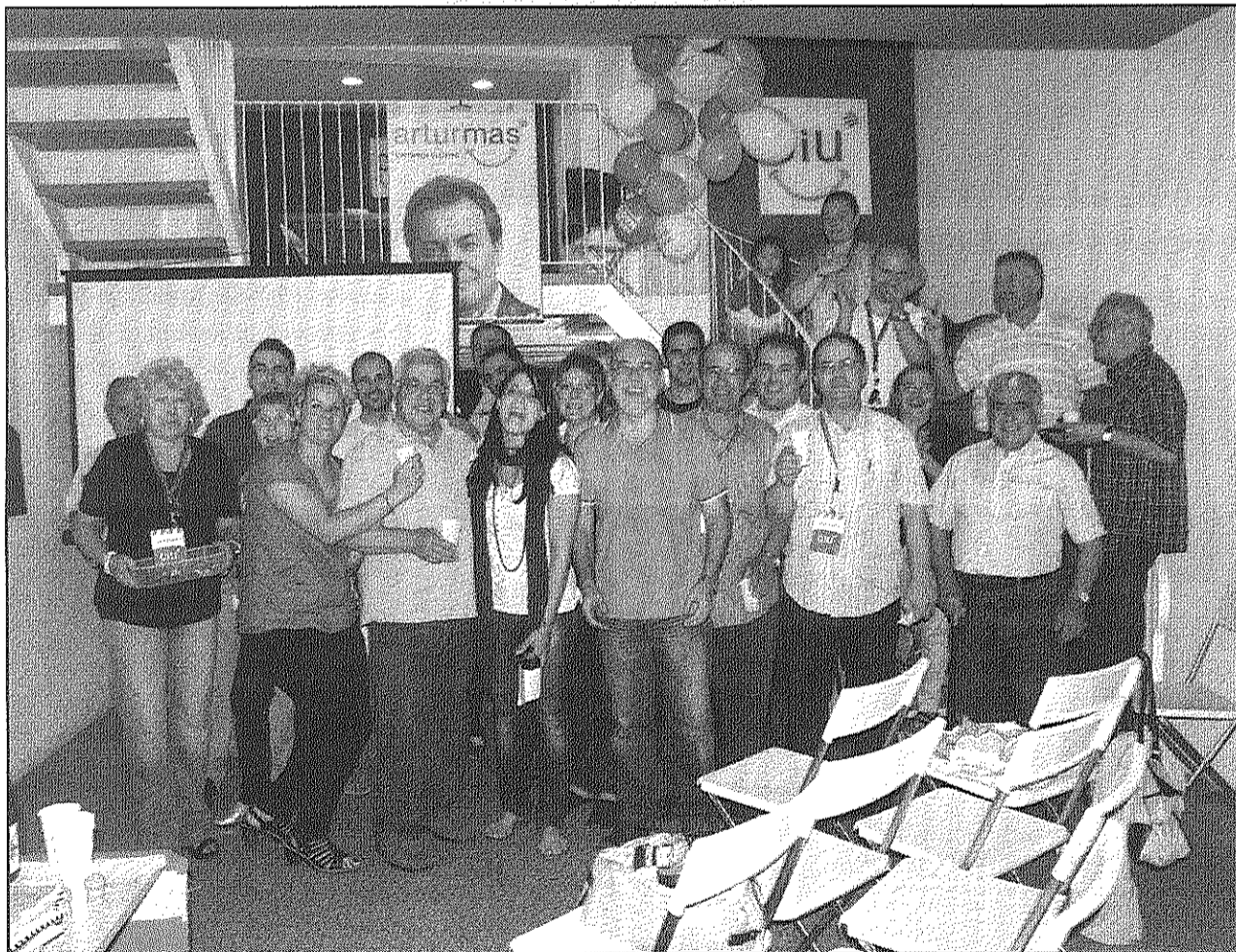
CiU celebra a la seva seu haver-se situat a tan sols 100 vots del PSC a aquests comicis (AdBM)