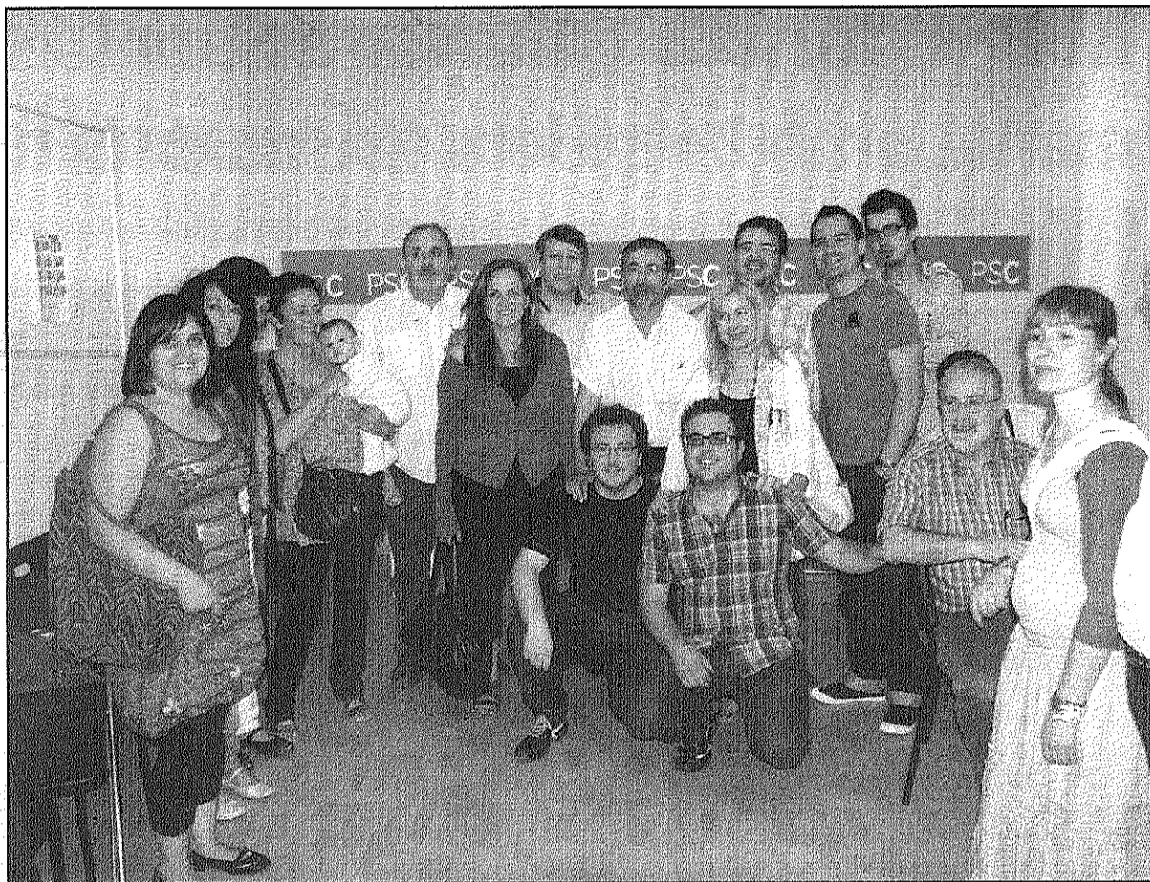
Militants i simpatitzants del PSC al seu local després de conèixer els resultats electorals (AdBM)

De fet, la clau de l'alcaldia continua en mans de la CUP però en cas que aquesta formació optés per no donar suport d'investidura a cap dels dos candidats més votats, la situació afavoriria decididament a Castaño que, com a força més votada, no li caldria ni tan sols el suport d'ICV per aconseguir l'alcaldia. En cas de donar-se aquesta situació, però, el govern municipal hauria de buscar suports puntuals per aprovar les votacions al Ple i tirar endavant el seu programa.