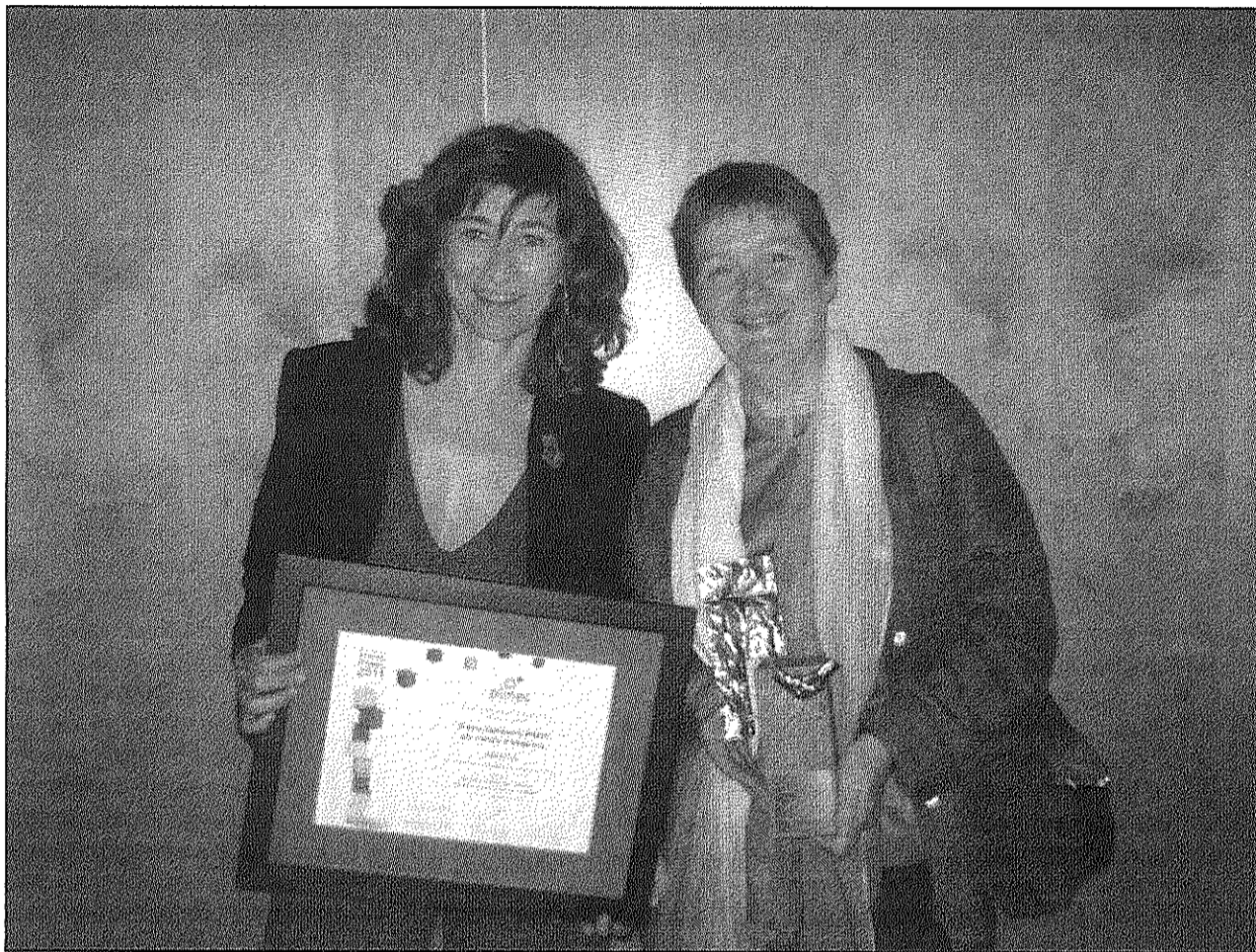
Les dues sòcies que dirigeixen Minuartia amb el guardó rebut de la Fundació PIMEC

Amb motiu del seu 25è aniversari l'empresa celebra una trobada de treballadors, col·laboradors i amics avui, divendres, a les 8 del vespre als jardins de la Rectoria Vella. Més de cent persones assis-