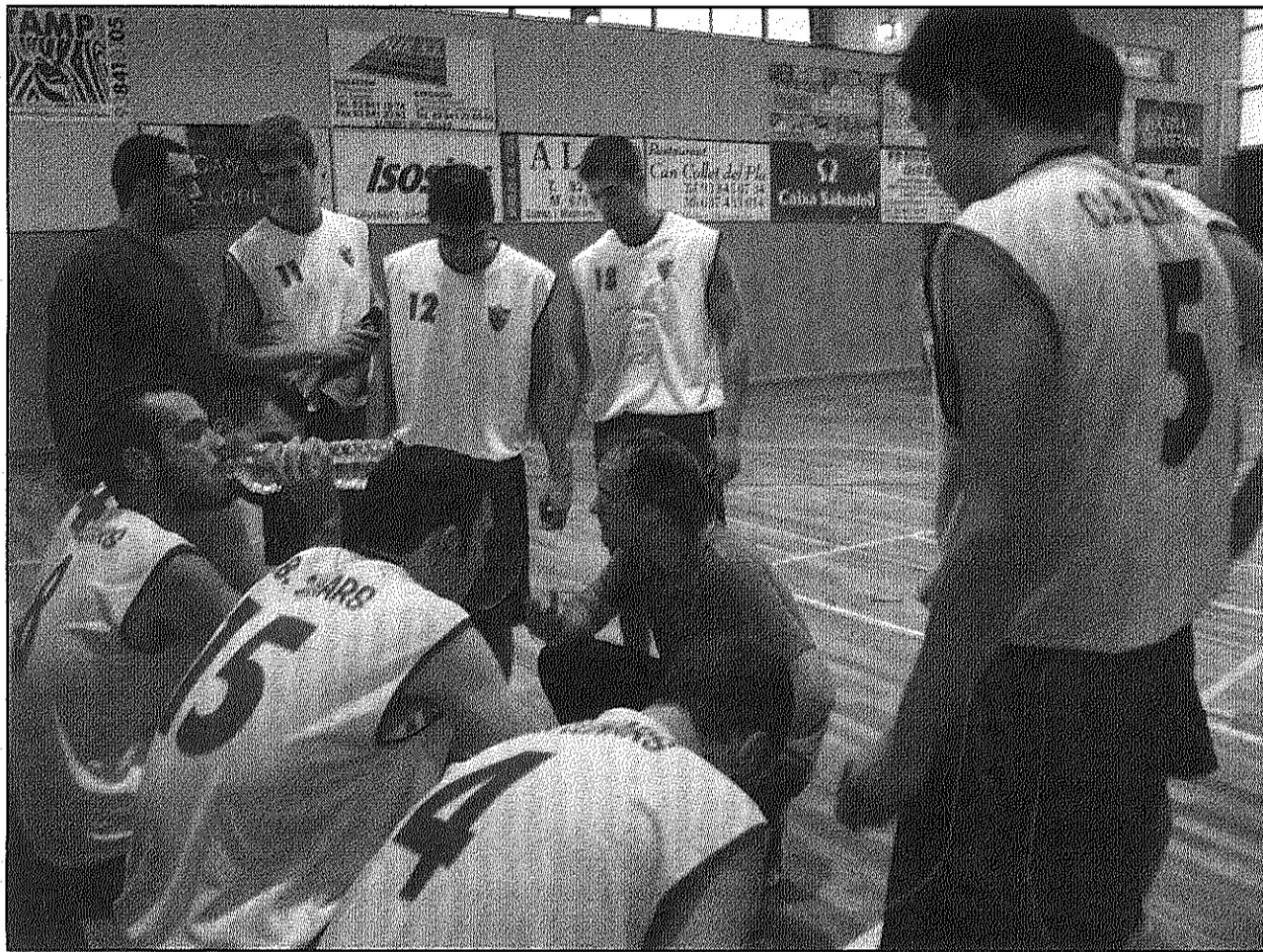
El CB Llinars comença aquest cap de setmana la feina per intentar mantenir-se a Segona catalana (AdBM)

Al grup setè de Tercera catalana, el CB Sant Celoni va imposar-se a la darrera jornada per 56-50 al CEB Sant Jordi. Un resultat que no evita que els celonins hagin de