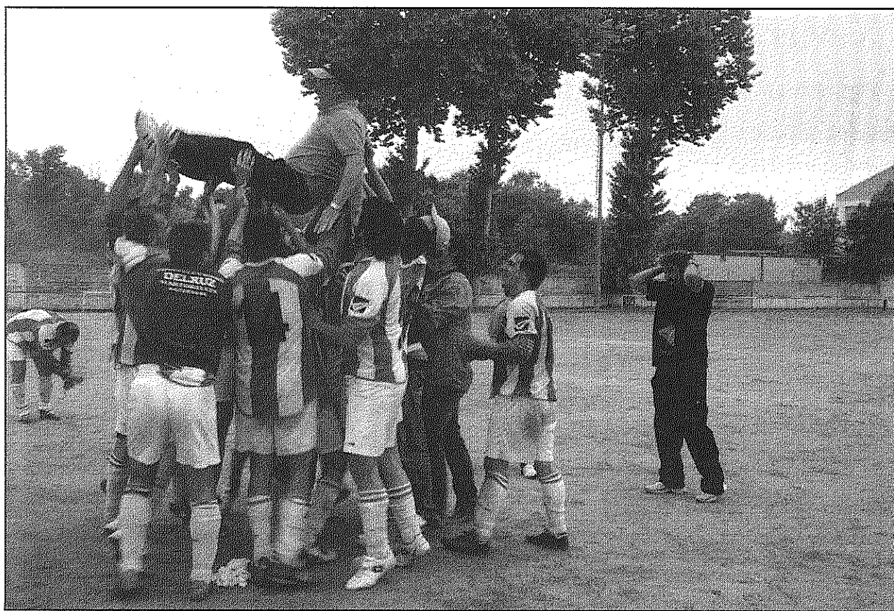
El CE la Batllòria Inacsa ja va celebrar l'ascens de categoria en la jornada anterior

Els batlloriencs van aconseguir l'ascens matemàtic la fa dues jornades. En tenia prou amb guanyar, i ho va fer. Però a més va veure com punxava el seu principal com-