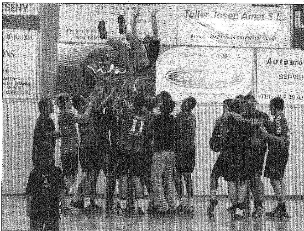
L'Handbol Vilamajor va celebrar l'ascens en acabar el partit a la pista del Sant Esteve (NEUS JULIÀ)

El resultat deixa el club de Sant Esteve a la penúltima posició de la fase d'ascens. Ara, l'entitat celebrarà diumenge el dinar de final de temporada al pavelló. Els tiquets