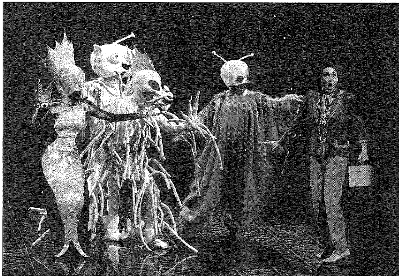
Una imatge de l'espectacle que Dagoll Dagom oferirà diumenge a l'Ateneu de Sant Celoni (AdBM)

Tot i que la seva estrena es va fer fa gairebé tres decennis, la versió actual s'adapta als nous temps, potenciant l'impacte visual i escènic,