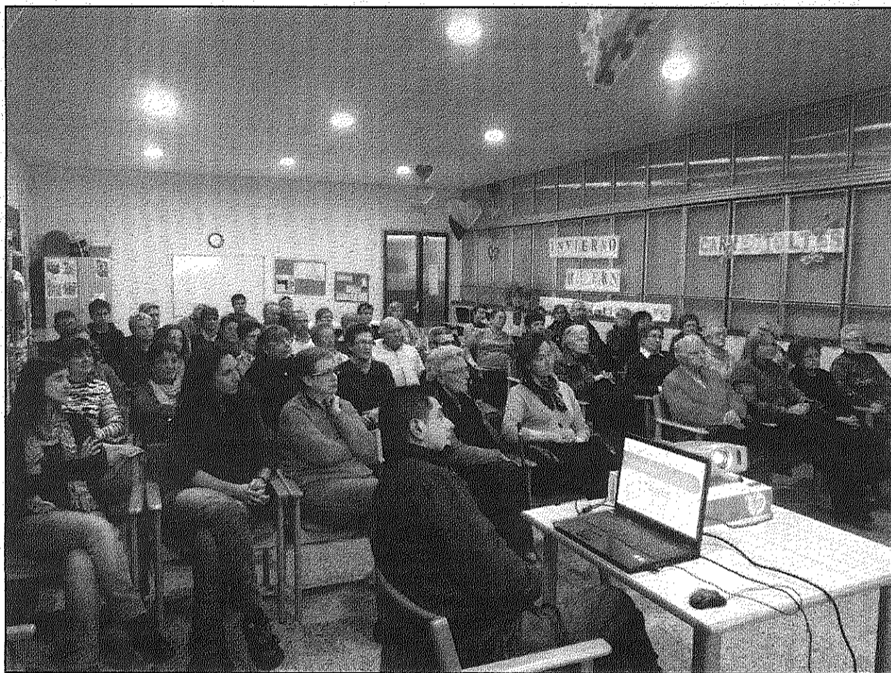
Una imatge de l'assemblea de l'ANABM celebrada dimarts a l'actual seu de l'entitat a Sant Ermenter