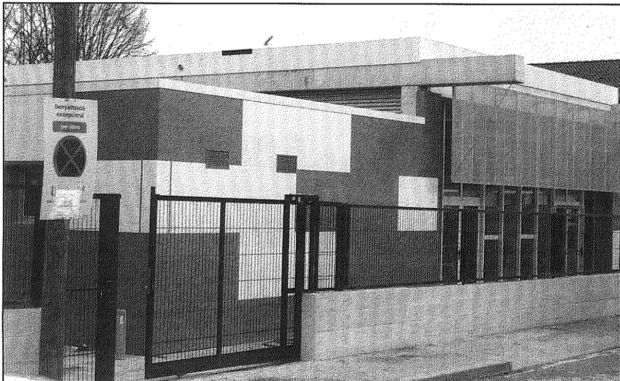
Una imatge del Centre de Dia que començarà a funcionar a partir del mes de maig (AdBM)

L'edifici, de nova construcció, compta amb prop de 700 metres quadrats i disposa d'una gran sala que es dedicarà al treball amb les pacients i que serà divisible en diverses zones segons el tipus d'activitat que s'hi vulgui realitzar. També comptarà amb serveis higiènics adaptats, office per a càte-