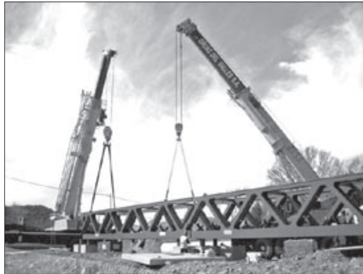
Unes grues col·locaven la nova passera aquest dilluns

Amb la modificació urbanística aprovada pel ple de