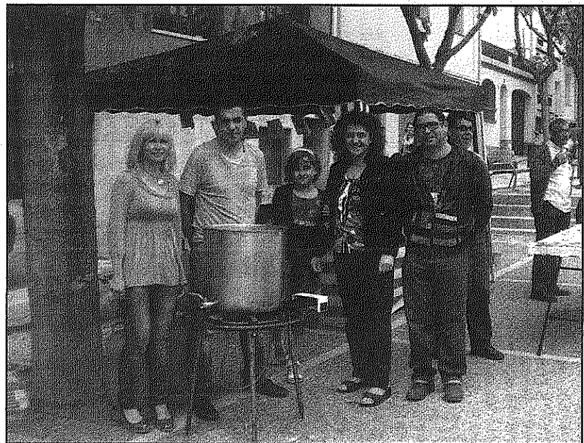
Una imatge del taller celebrat per ICV el cap de setmana passat