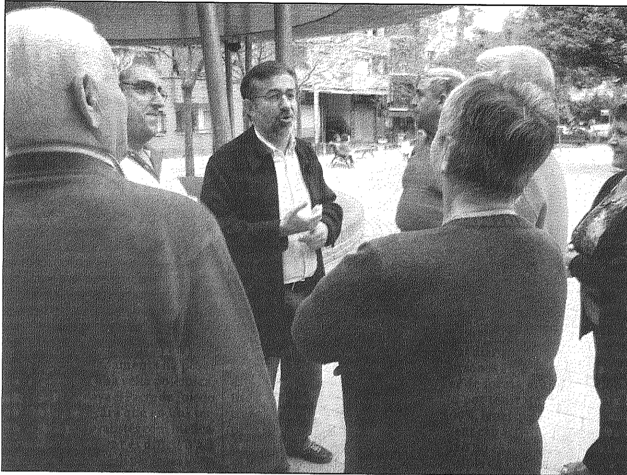
Una imatge de les visites que Castaño està fent als barris de Sant Celoni durant la precampanya (AdBM)

D'altra banda, el candidat de la formació socialista ha continuat amb les visites als barris celonins. Aquesta setmana ha visitat, acompanyat de diferents membres de la