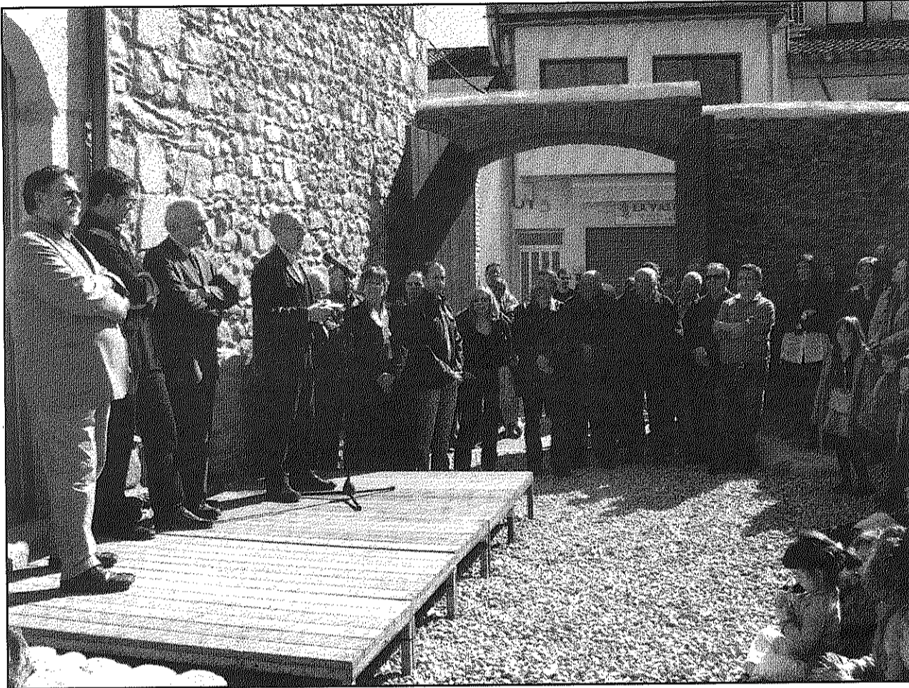
Una imatge de l'acte d'inauguració de les reformes a Can Bruguera i de la seu de l'Observatori de la Tordera (AdBM)

D'altra banda, per Deulofeu, la situació de l'Observatori de la Tordera a aquest espai dóna un valor