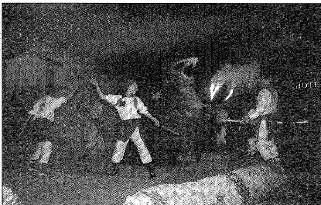
Bastoners i Diablers de Sant Celoni van intervenir a la representació de l'obra (AdBM)