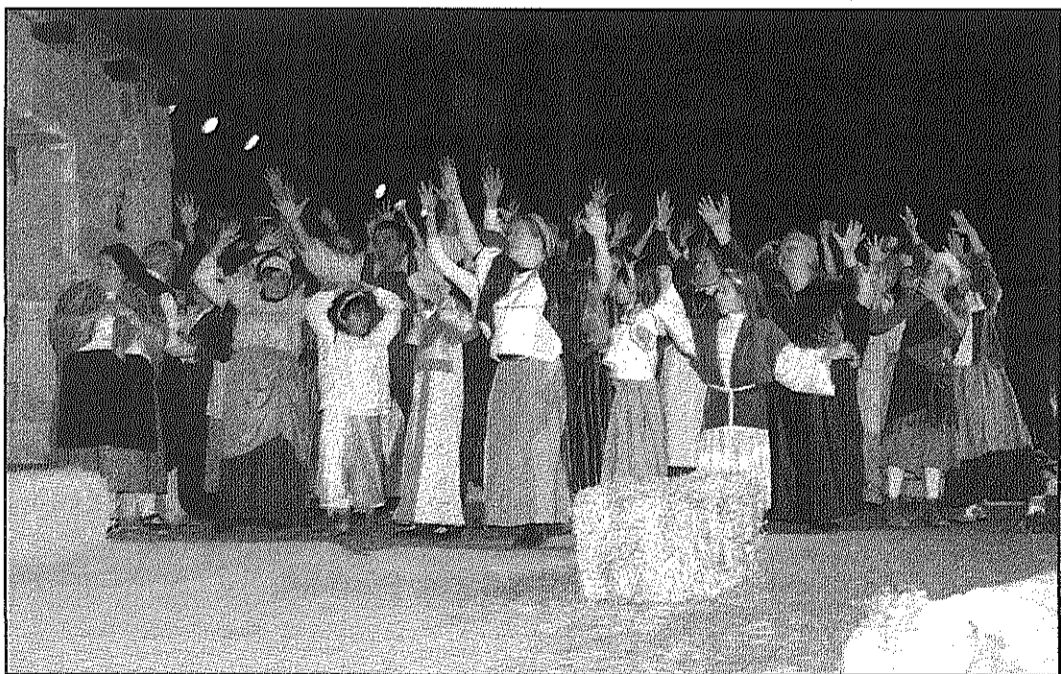
Desenes d'actors de l'escola de teatre i de grups locals van pujar a escena (AdBM)