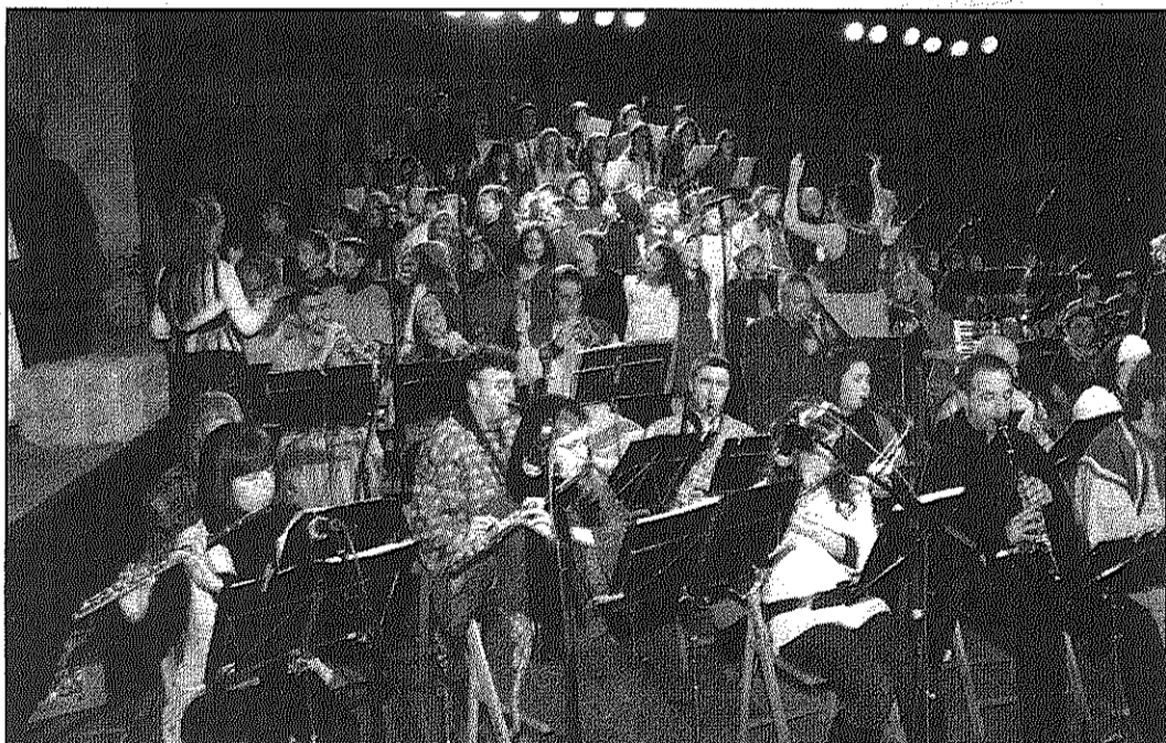
Els músics i la coral van donar el to més èpic de l'espectacle centrat en la llegenda local (AdBM)

REDACCIÓ. Sant Celoni Expectació, primer, i llargs aplaudiments després, van ser els que el públic que omplia la plaça de la Vila va dedicar a les més de 200 persones que van intervenir diumenge a la nit a la posada en escena de la 'Llegenda d'una espasa' organitzada pel Centre Municipal d'Expressió.