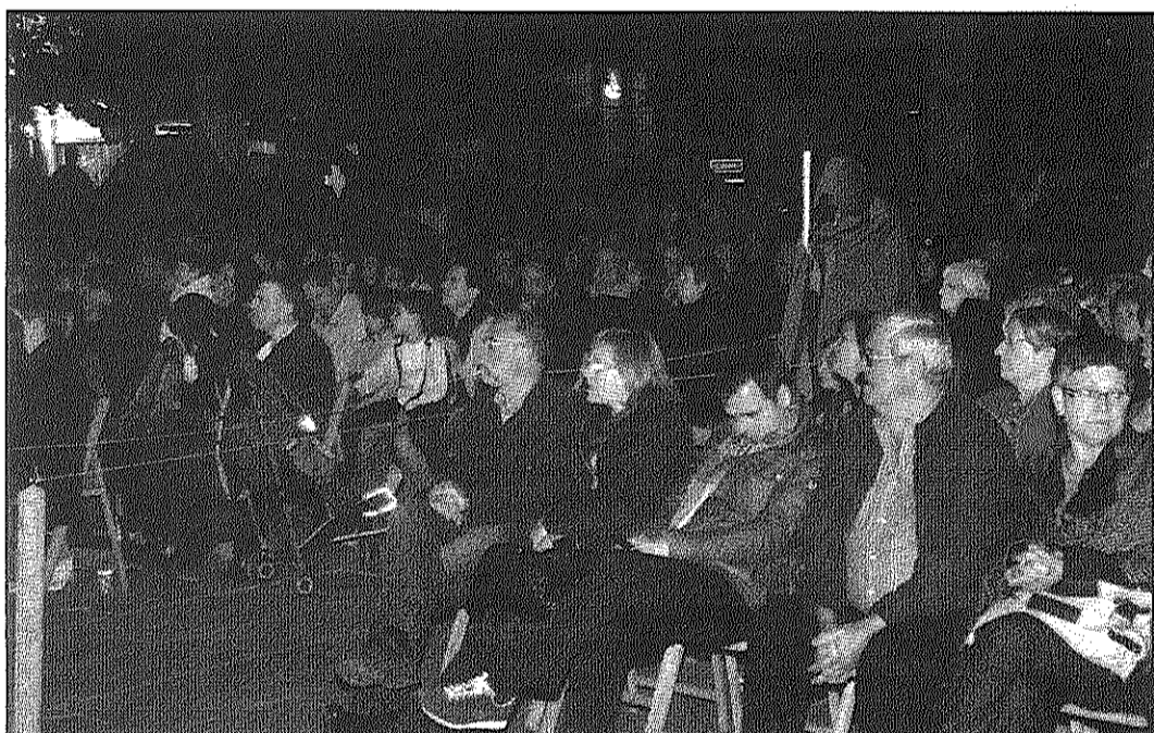
El nou emplaçament va permetre que alguns personatges sortissin entre el públic (AdBM)