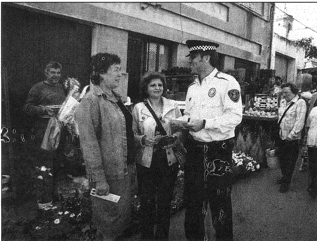
El Consistori aposta per una policia que sigui mediatra entre el teixit social i els comandaments policials (AdBM)

Entre les seves atribucions, els agents com a fil transmissor entre el barri i el seu teixit (associacions veïnals, comerciants, escoles...), els comandaments policials i altres serveis municipals competents en cada cas. Aquest nou servei, afirma