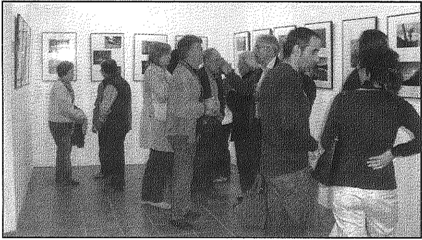
L'exposició del concurs es va inaugurar divendres a Can Ramis