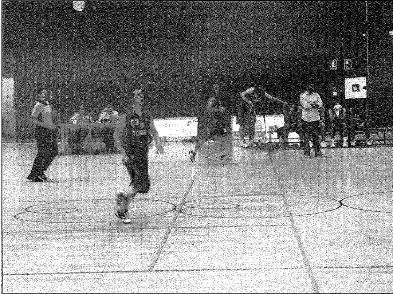
Els arbucians van fer un pas de gegant en el seu propòsit en imposar-se al CB Sant Feliu (A4BM)

Al grup setè de Tercera catalana, el CB Sant Celoni rep diumenge, a les 6 de la tarda, l'EBC la Llagosta en un altre partit important