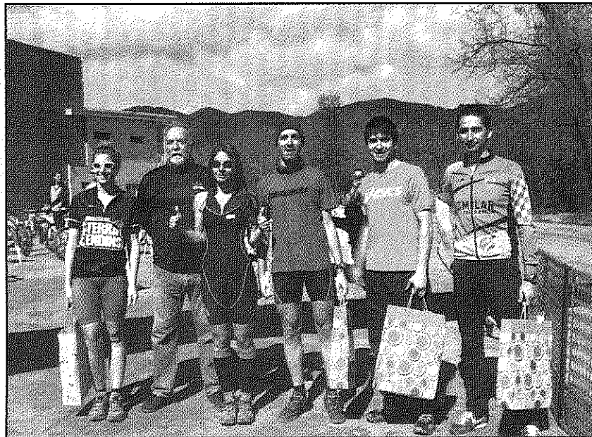
Una imatge dels guanyadors de l'edició d'enguany (AdBM)

Noguera va superar en el tram final al també arbucienç Beni Montero i va finalitzar la duatló amb un temps esplèndid d'1 hora, 15 minuts i 30 segons, un minut menys que Montero i amb dos minuts de diferència respecte Eduard Cabarrocas. En dones també va ser