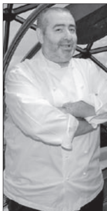
El cuiner Santi Santamaria

del que va ser en vida. Trinidad Jiménez el va qualificar el cuiner d'inoblidable, i va dir que havia estat un gran divulgador de la tradició culinària catalana i espanyola. En el seu discurs, Ferran Adrià també va aprofitar per incloure Santamaria entre els cuiners d'una generació que ha deixat una empremta inesborrable. Arzak va dir que li devia molt al cuiner de Sant Celoni.