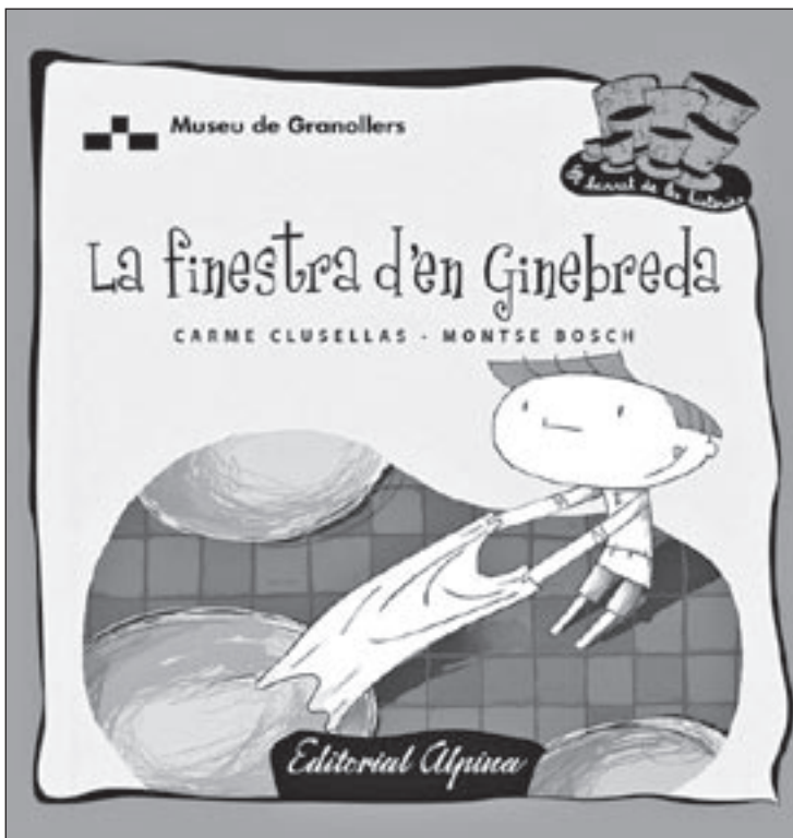
La portada del llibre escrit per Carme Clusellas i il·lustrat per Montse Bosch

L'Editorial Alpina va apostar l'any passat per obrir una nova línia de publicacions infantils que tinguessin com a eix central la història i el patrimoni de la ciutat, per fer-ho més proper als petits.