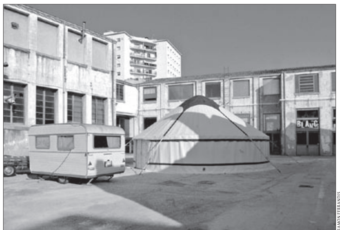
La nau estarà instal·lada aquest cap de setmana i el proper a Roca Umbert

La companyia arriba a Granollers amb una llarga trajectòria al darrere. Va néixer la tardor de 1991 en coincidir artistes procedents del circ i el teatre de carrer. Des dels seus inicis va portar a terme un projecte d'investigació i recerca d'un estil propi dins el llenguatge universal del circ. Un any després es van presentar a l'escena