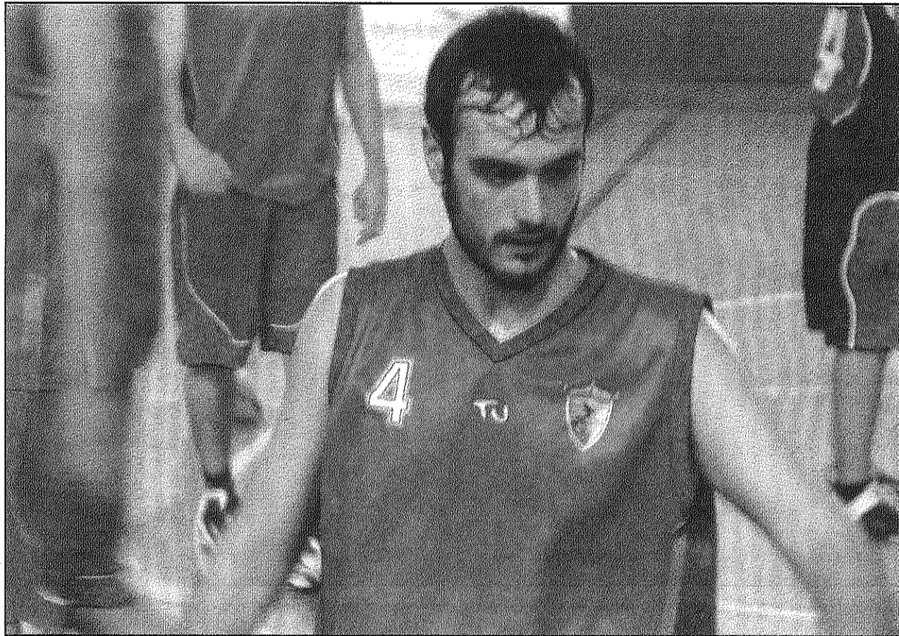
El CB Llinars continua tenint la salvació complicada després de caure contra el CB Canet

Per la seva banda, el CB Arbúcies es manté a la segona posició del seu grup de Tercera catalana però encara no pot dir blat davant un possible ascens. Després de guanyar 42-55 a la pista del CB Sant Narcís, l'equip no es pot permetre cap ensopegada en les quatre jor-