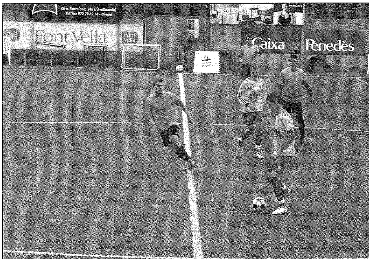
El CE Sant Hilari Font Vella B necessita sumar punts després de la derrota davant el Maçanet la Fira

■ El CE Sant Hilari Font Vella rep diumenge el líder del grup de Tercera, el CF Vilobí