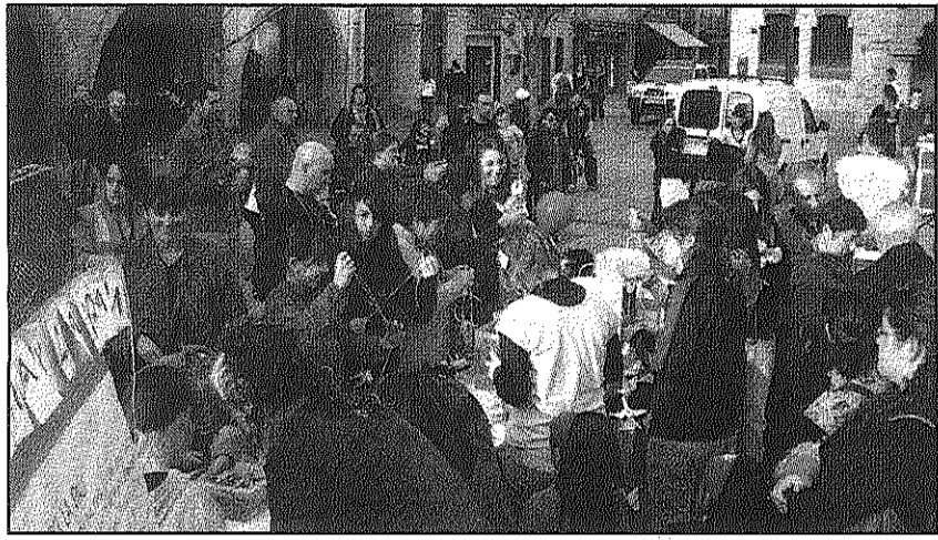
Una imatge de la festa celebrada a la plaça de la Vila dissabte

REDACCIÓ. Sant Celoni Els actes de la Setmana per la Pau de Sant Celoni, dedicada als conflictes oblidats d'arreu del món, van tancar dissabte amb un sopar solidari i una xerrada a la sala Cultural d'Unnim. Hores abans de l'àpat, però, la plaça de la Vila es va omplir d'activitat per la gran Festa solidària amenitzada per la Jovenut Alternativa de Sant Celoni (JASC), el grup Oicamina, diversos jocs, tallers i una fira del llibre de cooperació. En aquest acte, nens i nenes del municipi van decorar la plaça amb 1.535 grues de paper i amb desitjos de pau seguint la iniciativa d'una nena japonesa que va morir a causa dels efectes de la bomba d'Hiroshima.